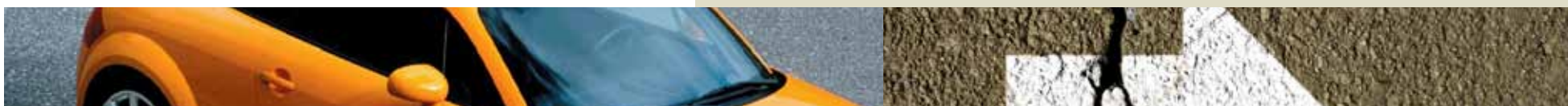
TABELA SEGURO VIDA EM GRUPO E ACIDENTES PESSOAIS ACE SEGUROS HUMANA SEGUROS PESSOAIS - FUTURA CORRETORA DE SEGUROS

- Para contratar enviar email para kseguros@hotmail.com que será imediatamente enviado formulário para ser preenchido e contratado ou entrar em contato com 44- 3026.7356. Junto com taria seguro